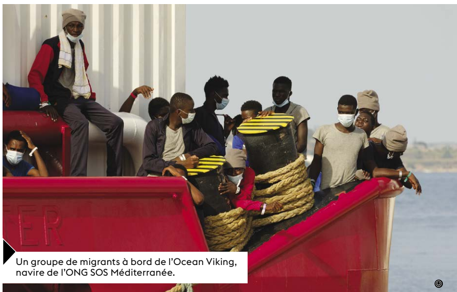
Un groupe de migrants à bord de l'Ocean Viking, navire de l'ONG SOS Méditerranée.