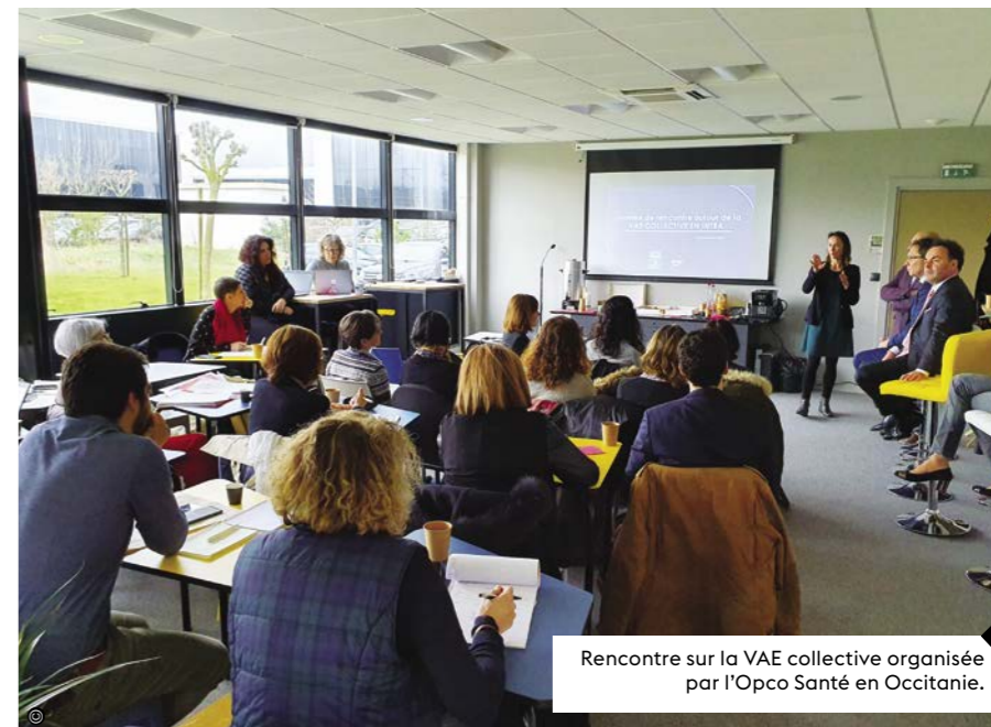
Rencontre sur la VAE collective organisée par l'Opco Santé en Occitanie.